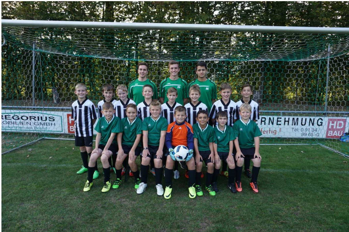
E1-Junioren, Saison 2016/17

Die einzige Kleinfeldmannschaft die in der Saison 2016/17 für den Spielbetrieb gemeldet ist, sind unsere E1-Junioren . In der Herbstrunde 2016 musste man sich nach zwei Siegen und fünf Niederlagen mit dem siebten Platz in der Achter-Gruppe zufrieden geben. In der Frühjahrsrunde 2017 werden die Mannschaften nach Leistungsstärke neu eingeteilt.