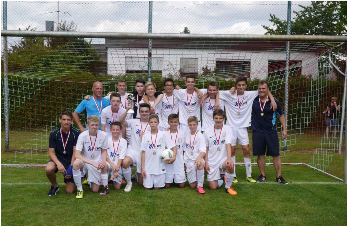
C-Junioren, KJR-Pokalsieger 2016, Kreisliga-Aufstieg 2016 (Meister Kreisklasse)