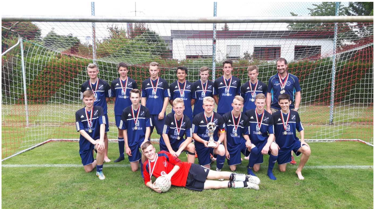
B-Jugend, KJR-Pokalsieger 2016, Kreisliga-Aufsteiger 2016